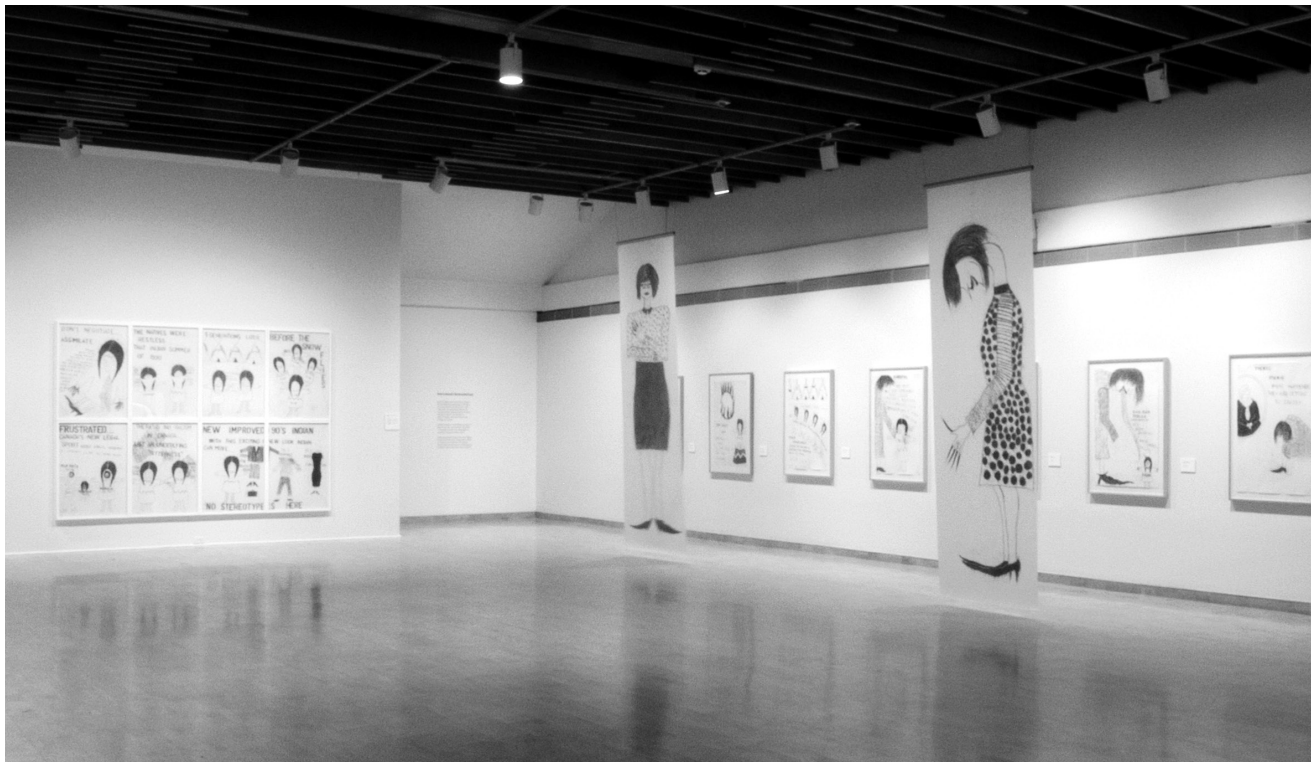
Figure 8 Ruth Cuthand: BACK TALK . Installation view, Mendel Art Gallery, 2011. On left: Living-Post-Oka-Kind-of-Woman , 1990. On right: Misuse is Abuse , 1990.